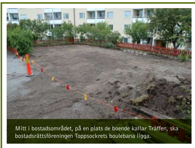
Mitt i bostadsområdet, på en plats de boende kallar Träffen, ska bostadsrättsföreningen Toppsockrets boulebana ligga.

såväl före som när man står med spaden i hand. Frågan om vad det kommer att kosta är vanlig. Och svaret är att det beror på vilken insats du själv är beredd att göra: