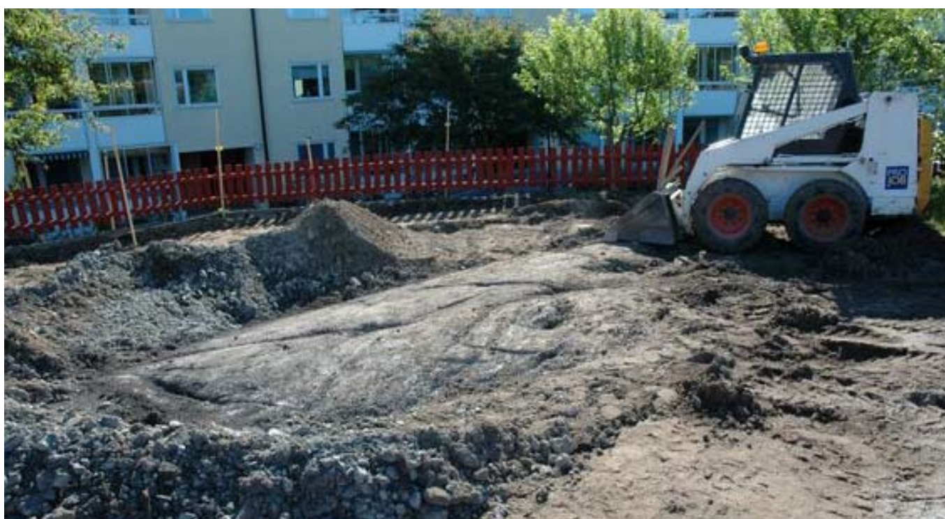
Äntligen får Svenska Bouleförbundets generalsekreterare en boulebana på hemmaplan. Följ honom och hans bostadsrättsförening Toppsockret när de anlägger sin bana. Men här har de visst stött på ett önskat problem...