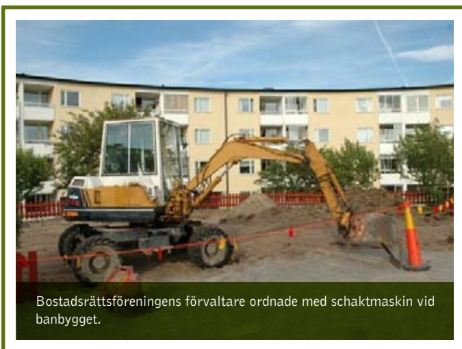
Bostadsrättsföreningens förvaltare ordnade med schaktmaskin vid banbygget.