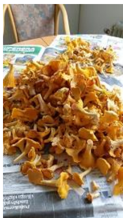
Jörgen gillar att plocka kantareller!