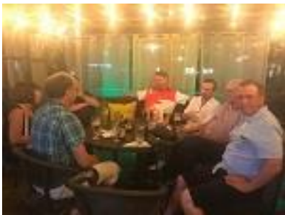
Klubbmiddag med NOR 2018!