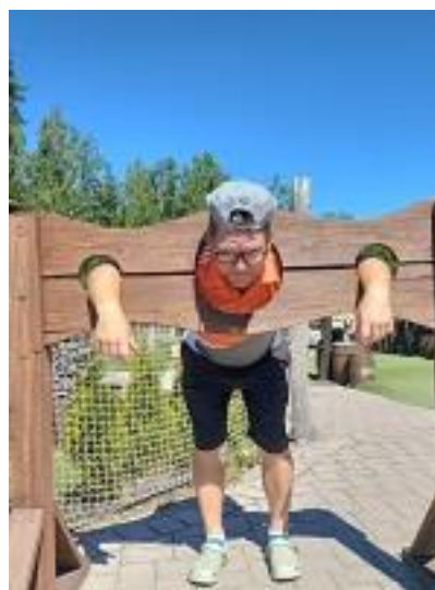
Piratgolf i Karlstad 2022!