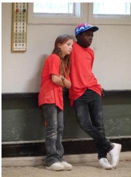
Jeremy/Lova väntar spånt

Två av lagen lyckades komma till A-slutspel och bäst gick det för Kian/Ängla som efter vinst i kvarten fick möta vinnarna av cupen i semifinal, Maya och Tobias från Svealands BF