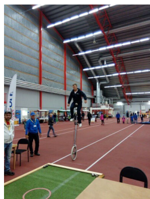
Boule på hög nivå

Kontakta hemkommunen om de inte redan har planerat sådant arrangemang, Idrottsförbundet är med.