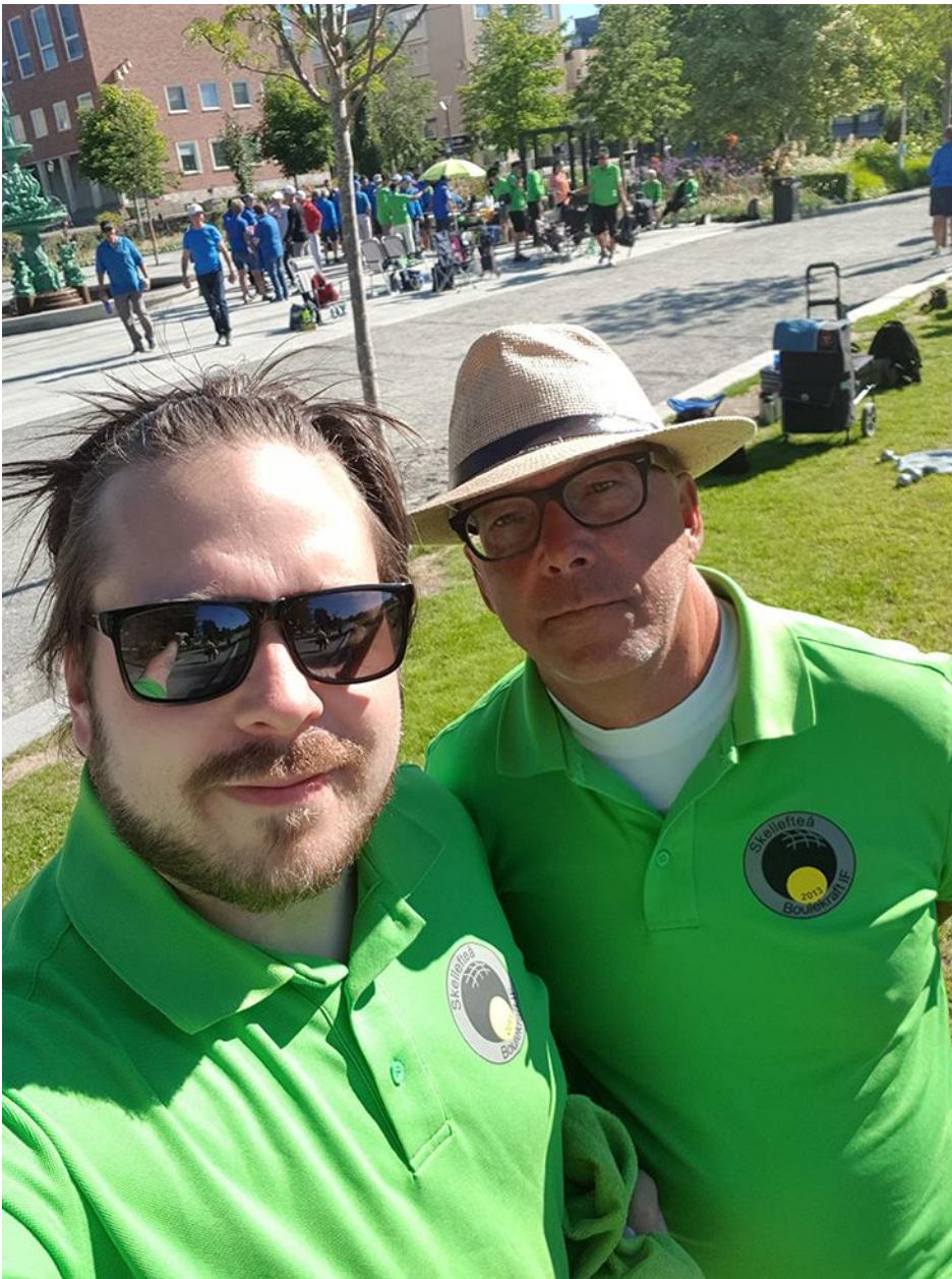
EA och "Gotte"!