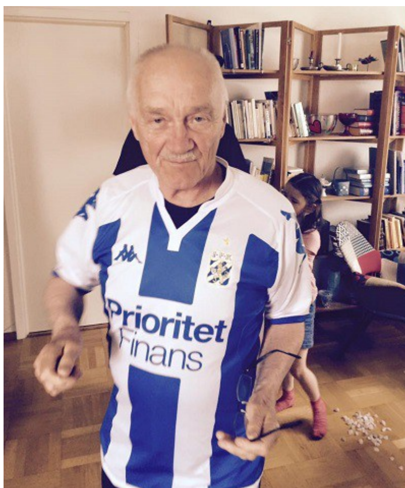
Folke håller på IFK Göteborg!

Detsamma. Dessutom ett diplom för Ditt stora engagemang för boulesporten.